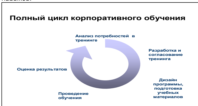
Рис. 2 – Фазы цикла корпоративного обучения

компании. Кроме того, более системным становится представление о сопровождении каждого шага программы обучения: становятся обязательными такие этапы подготовки тренинга как диагностика потребностей в обучении, ассессмент-центр, оценка эффективности тренинга, мониторинг использования полученных в ходе обучения навыков.