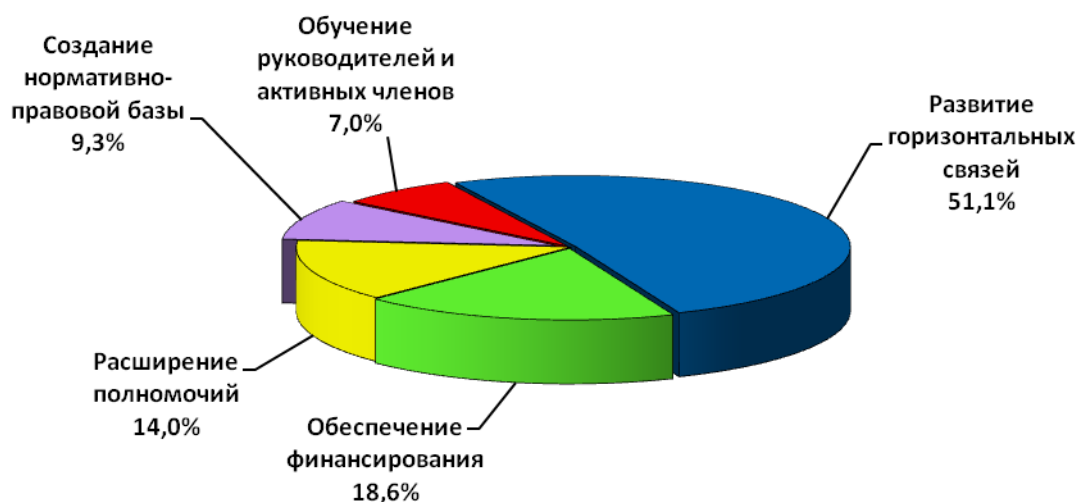
Рисунок 3. Предложенные направления оптимизации работы советов

Представители региональных советов направили следующие конкретные предложения по оптимизации работы Общественного совета по защите прав пациентов при Росздравнадзоре: