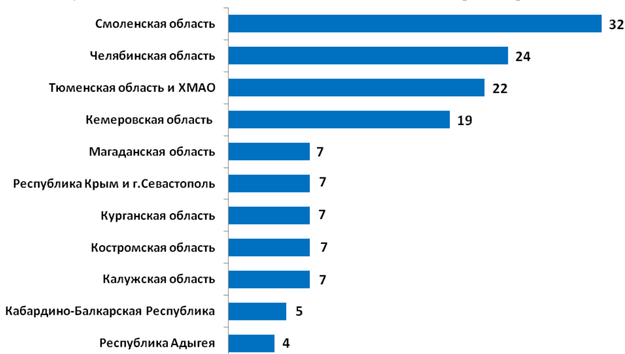
Рисунок 1. Количественный состав общественных советов в разных регионах РФ

По данным проведенного исследования, большинство членов ОС не имеют официального документа, подтверждающего их статус: 61 из опрошенных 78 ОС отметили, что у экспертов нет удостоверений членов совета. В 5 советах имеют удостоверения от 1 до 5 экспертов, еще 4 совета указали, что у них от 7 до 10 обладателей удостоверений. Примечательно, что отсутствие удостоверений является одной из актуальных трудностей в работе ОС, которую многие представители советов упоминают в последние пять лет.